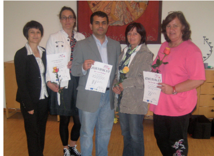
Die lerneifrigen VG-Mitarbeiter

Unsere Mitarbeiter nehmen laufend an Fortbildungen teil. 2010 besuchten wir bereits zum wiederholten Male die bewährte „Ausbildung für freiwillige Helfer in der sozialen Betreuung“ auf Einladung des Roten Kreuzes Kufstein und Bayern. Dafür bedanken wir uns sehr herzlich!